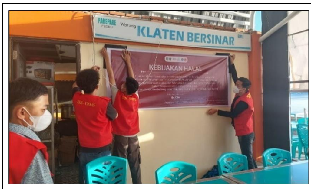
Gambar 4. Pemasangan spanduk kebijakan pada unit usaha UMKM.