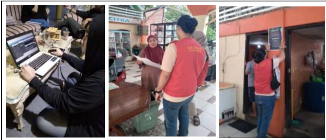
Gambar 3. Disain, Edukasi dan Penempelen Media Poster edukasi halal di Pare Beach.

Program Kerja Sosialisasi Kebijakan dan Edukasi Halal melalui Media Poster di Kawasan Kuliner Pare Beach Parepare terlaksana dan mendapat impresi yang positif. Hal ini dapat dilihat dari respon pelaku usaha di kawasan Pare Beach dalam menerima poster yang dibagikan. Kondisi ini merupakan satu indikasi bahwa pelaku usaha di kawasan Pare Beach membutuhkannya dan tertarik untuk memahami terkait penerapan halal. Para pelaku usaha di kawasan Pare Beach 1 menyambut dengan sangat baik dan mendukung segala bentuk kegiatan yang dilaksanakan.