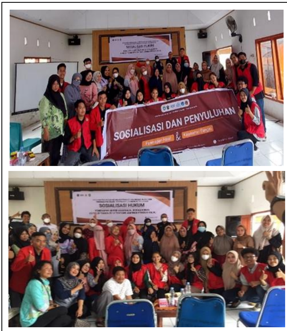
Gambar 6. Sosialisasi Penerapan Halal, Hukum, Penyelia dan Penyuluhan Keamanan Pangan.

Pelaksanaan sosialisasi penerapan halal, sosialisasi penyelia, sosialisasi hukum sertifikasi halal dan penyuluhan keamanan pangan dilaksanakan secara Bersama. Kegiatan dilakukan bersamaan untuk efektivitas waktu. Kegiatan dilaksanakan di Aula Kecamatan Soreang dengan mendatangkan narasumber dengan bidang keahlian masing-masing. Kegiatan sosialisasi dapat dilihat pada Gambar 6.