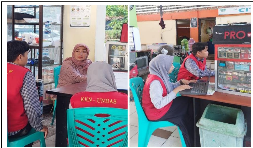
Gambar 5. Pendampingan pengisian dokumen Manual SJPH.

menjamin produksi halal, serta melakukan pendampingan untuk memperoleh sertifikasi halal dari MUI. Pada kegiatan pendampingan ini, proses pendampingan dilakukan secara langsung dengan melakukan kunjungan ke lokasi pelaku usaha di Kawasan wisata kuliner Pare Beach.