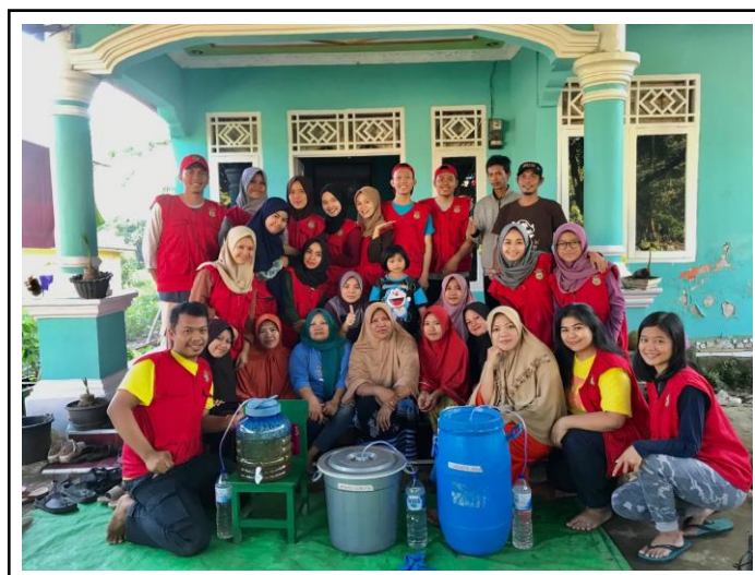
Gambar 4. Kerja pelatihan oleh mahasiswa ke kelompok wanita petani dalam kegiatan pembuatan pestisida Nabati.