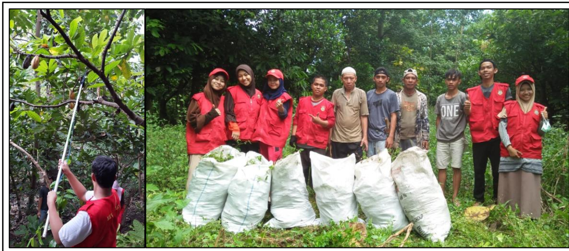
Gambar 3. Kerja bersama mahasiswa dan petani dalam kegiatan pemangkasan dan Pembuatan Pupuk Kompos.

Asman, Ade Rosmana, dan Zainal: Pendampingan Petani melalui Pembelajaran Pemberdayaan Masyarakat untuk Peningkatan Produktivitas Kakao di Kabupaten Bantaeng.