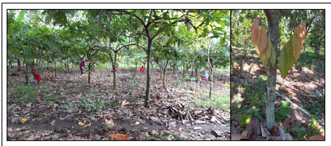
Gambar 2. Kerja bersama mahasiswa dan petani dalam kegiatan Peremajaan Tanaman (Sambung Samping).

Selama mendampingi, mahasiswa bersinergi, belajar, dan bekerja bersama petani dikebun kakao dengan berbagai kegiatan pendampingan diantaranya praktek perkebunan kakao yang baik, peremajaan tanaman, manajemen pembibitan, pembuatan dan aplikasi pupuk kompos dan pestisida nabati, pengelolaan pasca panen, dan penggunaan mikroorganisme pengendalian penyakit tanaman (Gambar 2, 3, 4 dan 5).