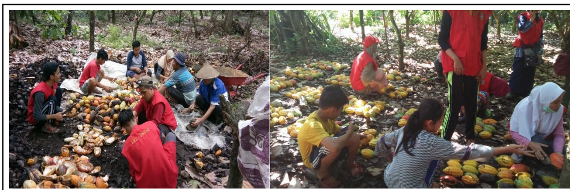
Gambar 5. Kegiatan evaluasi insiden hama dan penyakit oleh mahasiswa dan petani.