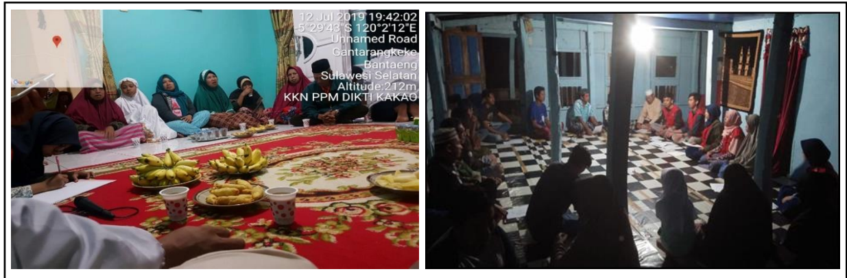
Gambar 1. Kegiatan Tudang Sipulung bersama petani untuk menentukan permasalahan dikebun petani.

Kegiatan ini sangat diapresiasi oleh petani, mereka sangat puas terkait kinerja pendampingan ini. Kegiatan ini membuat petani menjadi semangat kembali memelihara kebun kakaonya karena mendapat perhatian dan pengetahuan baru. Hasil kegiatan ini membuat mereka meminta kembali didampingi di tahun-tahun mendatang agar dapat berkesinambungan.