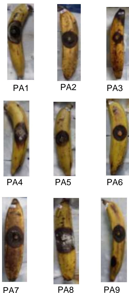
Gambar 3. Gejala Busuk pada Permukaan Kulit Pisang Ambon oleh Tiap Isolat pada Hari ke-9

Berdasarkan hasil pengamatan diameter pertumbuhan isolat jamur hasil inokulasi menunjukkan bahwa 9 isolat (PA1, PA2, PA3, PA4, PA5, PA6, PA7, PA8 dan PA9) dapat tumbuh pada permukaan kulit buah pisang dan mampu mengakibatkan kebusukan pada permukaan kulit buah pisang. Gejala yang ditimbulkan pada permukaan kulit buah pisang ambon ditunjukkan adanya bercak cokelat sampai kehitaman dan pertumbuhan miselium di atas permukaan kulit buah pisang ambon (Gambar 3). Menurut Mahasuk et al. (2008), buah yang terserang jamur akan menjadi busuk pada kulit dan berwarna hitam. Gejala hitam menurut Palupi et al. (2015) yaitu terjadi akibat perkecambahan konidia jamur dan menembus jaringan kulit buah. Berdasarkan hasil pengamatan, persentase kerusakan daging buah pisang ambon oleh isolat jamur penyebab busuk buah pisang ambon pada hari ke-9 menunjukkan sebagian besar daging buah menjadi lembek sehingga tidak layak dikonsumsi. Menurut Silsia et al. (2011), syarat kesegaran dan layak konsumsi buah pisang ambon adalah kulit buah masih berwarna kuning segar dan tekstur daging buah tidak lembek. Ambarita et al. (2015) menyatakan daging buah pisang ambon segar memiliki warna putih kekuningan. Hal ini menunjukkan bahwa buah pisang yang diinokulasikan oleh isolat PA1, PA2, PA4, PA5, PA6, PA7, PA8 dan PA9 tidak dapat dikonsumsi setelah 9 hari inkubasi, sedangkan buah pisang yang terinfeksi isolat PA3 masih bisa dikonsumsi karena daging buah masih berwarna putih kekuningan.