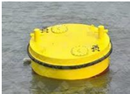
Gambar 1. Mooring Buoy

Kebutuhan akan minyak dan gas tiap tahunnya semakin meningkat. Hal ini menjadikan perkembangan dalam dunia minyak dan gas menjadi sorotan lebih saat ini mengacu pada teknologi dan eksplorasi minyak bumi. Namun beberapa akibat dari kegiatan eksplorasi tersebut menyebabkan kecelakaan kerja seperti terjadinya oilspill (minyak tumpah) di laut pada saat proses pengisian dan transfer hasil minyak bumi. Hal tersebut disebabkan karena sistem tambat yang tidak mumpuni menahan gaya yang diberikan oleh kapal tanker atau Floating Production, Storage & Offloading (FPSO). Sistem tambat pada kapal haruslah sesuai standar yaitu disesuaikan dengan besarnya DWT kapal yang akan bertambat.