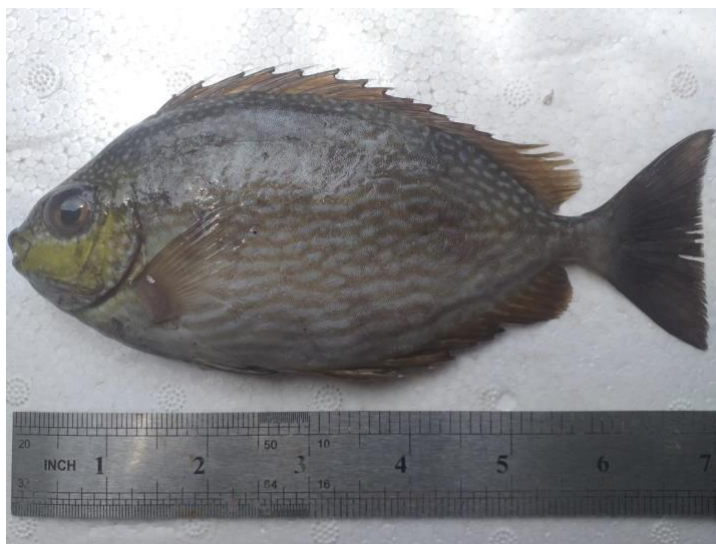
Gambar 2. Ikan baronang Siganus javus Linnaeus, 1766 yang didapatkan di TPI Paotere