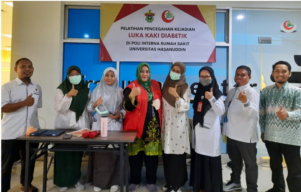
Gambar 6. Tim Pengabdian Masyarakat

Tujuan dilakukannya pelatihan pencegahan kejadian luka kaki pada pasien diabetes di Poliklinik penyakit dalam Rumah Sakit Universitas Hasanuddin, agar pengetahuan pasien terhadap perawatan kaki, pemeriksaan kaki, pola diet dan aktifitas dapat meningkat, sehingga diharapkan para pasien diabetes dapat termotivasi melakukan pencegahan kejadian luka kaki. Edukasi pada pasien diabetes merupakan salah satu komponen penting dalam pencegahan luka kaki diabetes. Pendekatan edukasi pencegahan kejadian luka kaki diabetes merupakan pendekatan terpadu yang melibatkan pasien, keluarga, dan tenaga kesehatan yang bertujuan untuk meningkatkan pengetahuan dan keterampilan pasien (Chapman, 2017). Pendekatan edukasi dan supportive juga dapat meningkatkan kekuatan otot dan rentang gerak pada pasien post-stroke (Sjattar dkk., 2022). Penelitian lainnya juga melaporkan bahwa, penglibatan keluarga berdampak positif terhadap proses penyembuhan luka kaki diabetes (Appil dkk., 2022).