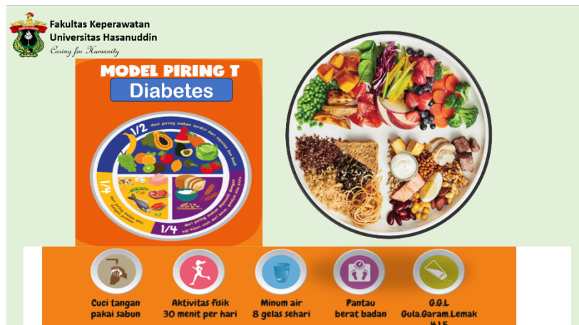
Gambar 1. Contoh model piring T, untuk porsi makan pasien diabetes

prioritas masalah, maka tindakan selanjutnya melakukan persuratan Direktur RS. Universitas Hasanuddin untuk perizinan. Data Kunjungan penderita DM adalah 10.234 kasus dalam kurun waktu lima tahun terakhir (RMRSPTNUH,2022) dan hasil wawancara dengan perawat poliklinik di RS. Universitas Hasanuddin menyatakan bahwa belum pernah dilaksanakan kegiatan pelatihan tentang pencegahan kejadian luka kaki diabetik dan pasien DM yang berkunjung hampir separuhnya mengalami luka pada kakinya, Hal ini menunjukkan masih kurangnya pengetahuan dari pasien dan keluarganya tentang pencegahan kejadian luka kaki diabetik. Dibawah ini beberapa gambar menu sehat dan aktifitas fisik untuk pasien diabetes.