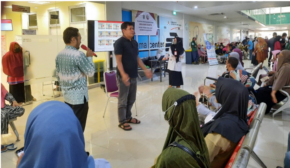
Gambar 4. Proses re-demonstrasi