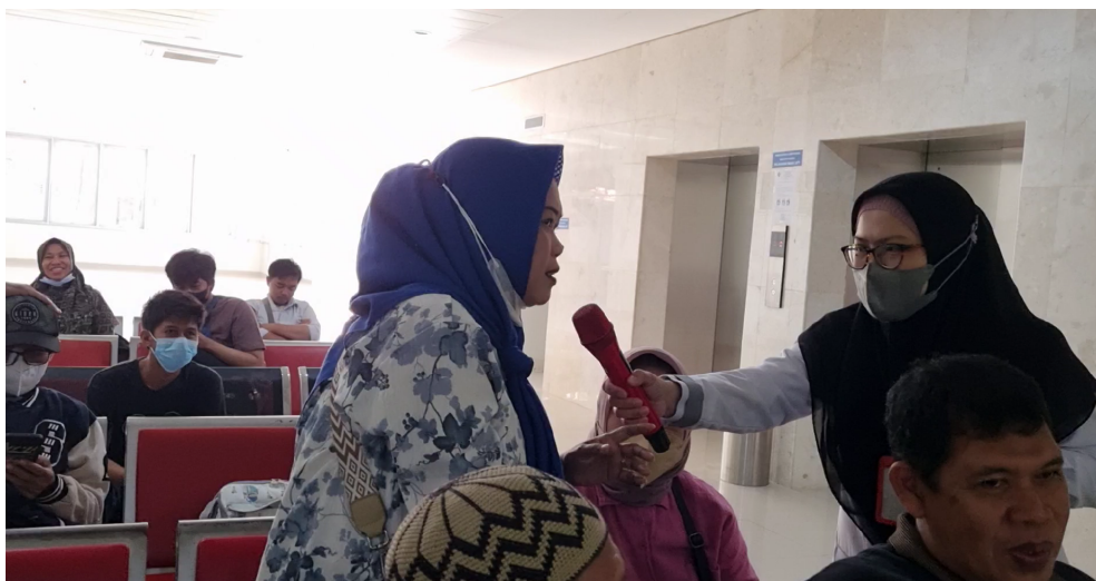
Gambar 5. Proses Tanya-jawab