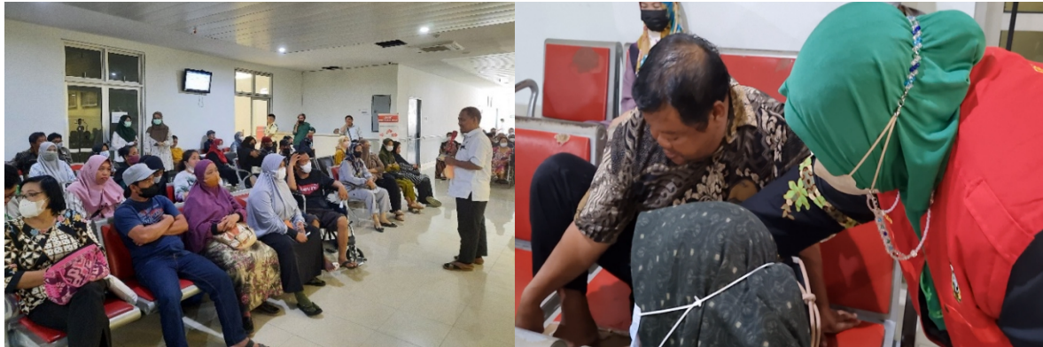
Gambar 3. Proses edukasi

Keperawatan, Fakultas Keperawatan Universitas Hasanuddin Makassar. Kegiatan pengabdian ini dibantu juga oleh perawat di RS. Unhas. Kegiatan dan Tim pengabdian kepada Masyarakat dapat dilihat pada Gambar dibawah ini: