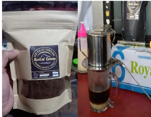
Gambar 1. Kopi Torabika

Berikut beberapa gambar produk dari UMKM yang dibuat dalam bentuk website.