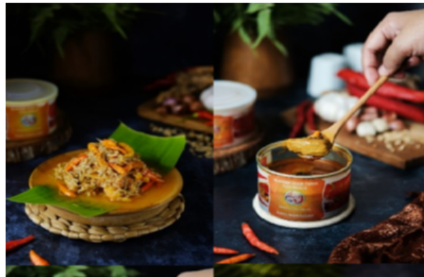
Gambar 2. a. Produk UMKM Bale Pallumara Penja