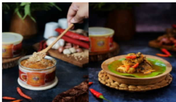
Gambar 2b. Produk UMKM Bale Pallumara Penja

Pada aplikasi ini tim pengabdian bekerja pada area front end dan back end atau sebagai full stack developer , yaitu